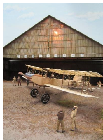
NFS 2号機模型と日本飛行学校格納庫ジオラマ

担当 / 企画普及係 篠、森 四日市市安島一丁目3番16号 059-355-2702